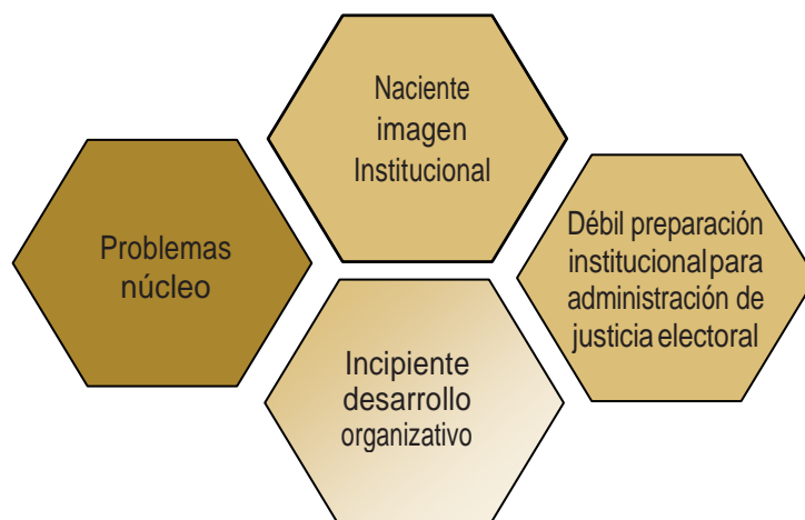
Figura 1. Problemas núcleo identificados

Los «problemas núcleo» apuntados y el análisis de causas constituyen el fundamento para la formulación del Plan Estratégico del TJE, entendido como su dirección y programación estratégica de mediano plazo, como se expone en los apartados siguientes.